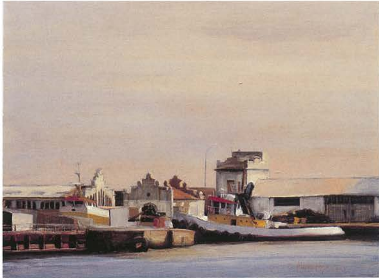
9 Melangia | Oli sobre tela, 46 x 60 cm