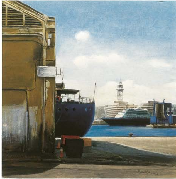
22 Tradició i modernitat | Oli sobre tela, 80 x80 cm