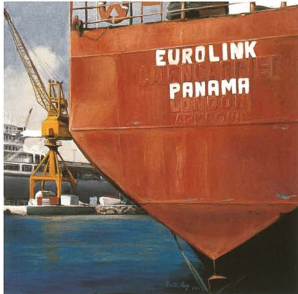
25 Fòrum Nàutic | Oli sobre tàblex, 80 x 80 cm