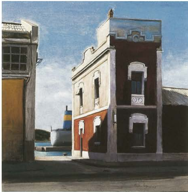
23 Escletxa oberta | Oli sobre tela, 80 x 80 cm