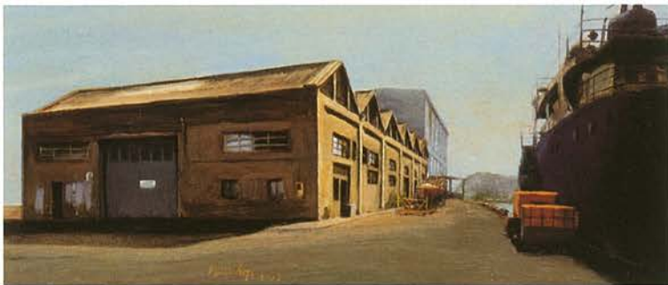
11 L'altre Barcelona olímpica | Oli sobre tàblex, 34 x 79 cm