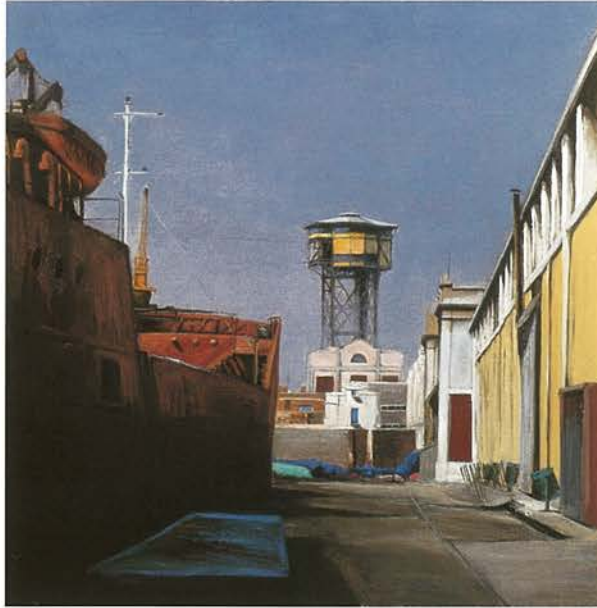
24 Logística marítima | Oli sobre tela, 80 x 80 cm