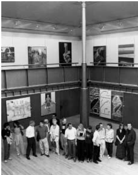
Varios de los artistas participantes en la muestra, ayer en la Parés

El comisario de la muestra -ampliada respecto a la que pudo verse en Valencia- dice que no ha tratado de hacer ningún manifiesto ni ir en contra de nada, sino que ha intentado hacer visible un tipo de pintura que está ninguada por los museos. "Mi apreciación del arte no es excluyente, porque lo contrario es empobrecer el arte. Desde finales de los ochenta y en los noventa ha habido una tendencia a identificar el arte contemporáneo con las instalaciones, los derivados del arte povera, el expresionismo abstracto o las vanguardias, y se ha destacado el auge de la instalación y de la fotografía, pero creo que la pintura metarrealista forma parte también del arte contemporáneo", dice Buñell, quien cree que este tipo de figuración antirrealista propone fórmulas nuevas. Comparte con el surrealismo la reve-