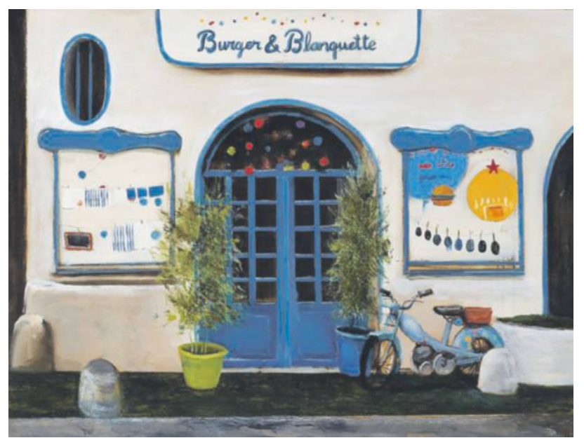
Neus Martín Royo: 'Palo Alto market III'