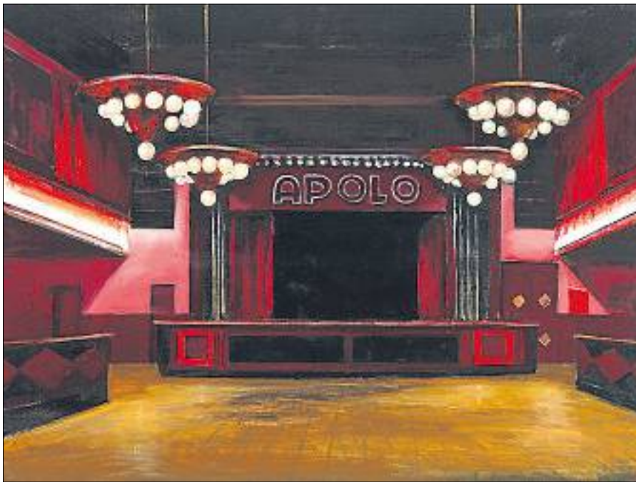
Apolo, oli sobre taula de Neus Martín Royo

mostra individual a Barcelona és introduïda per un lema meta-realista de Magritte: "Tot el que és visible amaga una altra cosa visible". Owens tendeix a la indefinició, i només algun dels seus díptics concilia misteri i claror. Murcia compon mitjançant constel·lacions d'imatges, però solen tenir intensitat també preses aïlladament. Galeria Trama. Petritxol, 5. Fins al 3 de març.